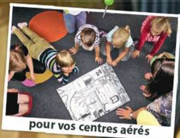
pour vos centres aérés