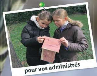
pour vos administrés