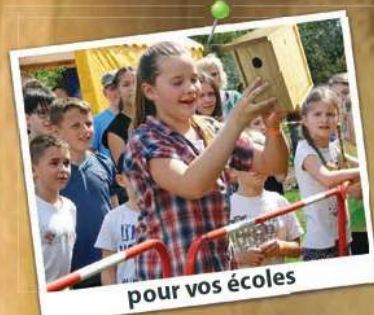
pour vos écoles

Eduquer par le jeu dans une démarche participative