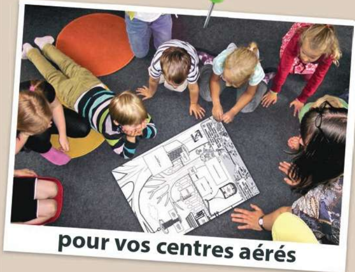
pour vos centres aérés